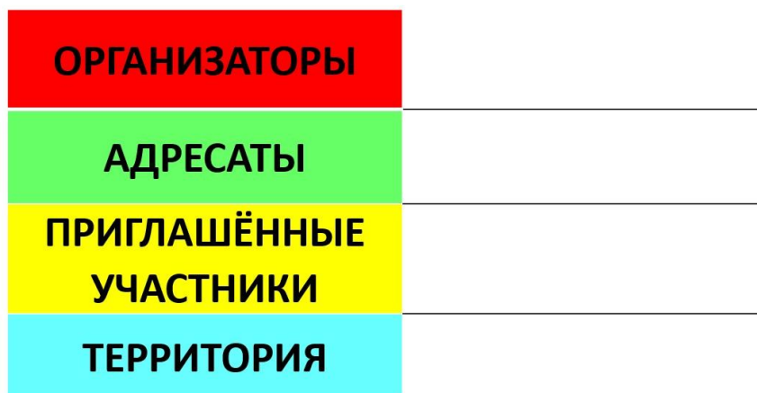
Рис. 1. Вид шаблона для раскладки пасьянса

1. В каждом «пасьянсе» обязательно должны быть карточки всех цветов. Для этого используется шаблон (см. рис. 1), справа от которого в ряд выкладываются используемые карточки соответствующих цветов.